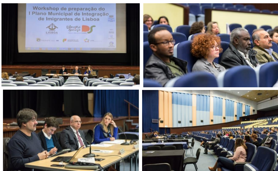
Figura 4. Apresentação do diagnóstico e SWOT no Fórum Lisboa