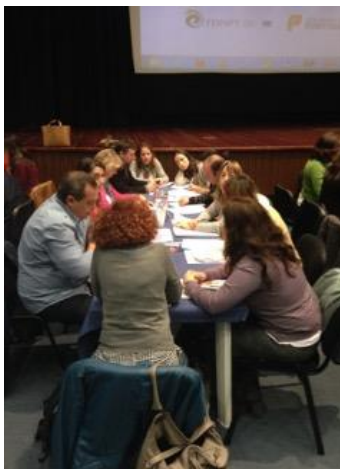
Figura 6. Mesa 3 - emprego e empreendedorismo e qualificação(esq.) e Mesa 4 - participação cívica e política dos imigrantes e associativismo