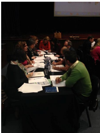
Figura 5. Mesa 1 - acolhimento e habitação(esq.) e Mesa 2 - saúde e educação (dir.)