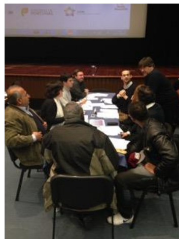
Figura 7. Mesa 5 - diálogo inter-religioso e intercultural e dinâmicas culturais urbanas (esq.) e Mesa 6 - racismo, discriminação e exclusão social (dir.)