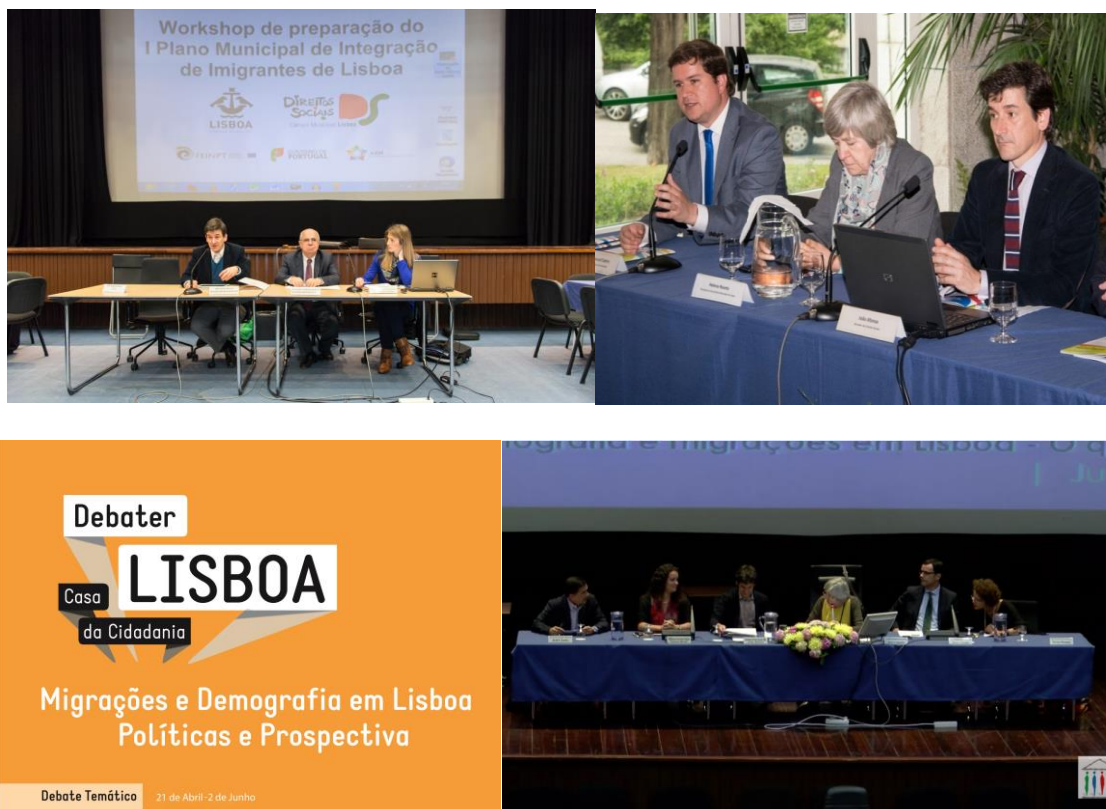
Figura 2. Workshop com participação focalizada, lançamento “Roteiro Lisboa Imigrante” e Debate Temático: “Migrações e Demografia em Lisboa”

A auscultação aos Nacionais de Países Terceiros permitiu identificar problemáticas e encontrar medidas que vão ao encontro das soluções para as mesmas.