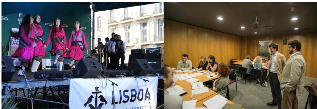
Figura 3. Sessão de Auscultação do PMIL, ACM - Fora de Portas 2015, Fórum Municipal da Interculturalidade 2015 e Workshop com participação focalizada